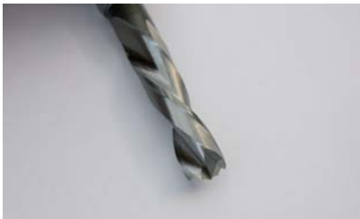
Der Stehle 2042 VHW-Dübelbohrer