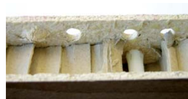
Bohrervergleich links: Standardbohrer rechts: Stehle VHW-Dübelbohrer